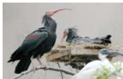
昨年はクロトキ用の巣台で巣作りした

繁殖行動が本格的になったのは昨年からで、幼鳥たちも繁殖適齢期になっていました。5月の上旬、