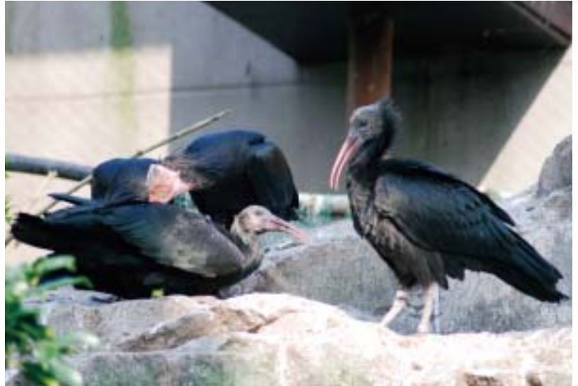
巣立ちした2羽のヒナ、親鳥といっしょのことが多い

そして5月8日、親鳥は一日中巣から離れなくなりました。食事の時も交代で巣に座り、巣を空けることがなくなったのです。前日までとは明らかに行動が違います。この日の朝、産卵したに違いありません。巣箱での巣作りなので、今までのように飼育舎の屋根からのぞいて見ることはできません。産卵を信じてじっと待つことにしました。ホオアカトキの抱卵日数