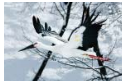
兵庫県豊岡市で放鳥されたコウノトリ

着させることがトキ復活作戦の目標です。同時に佐渡以外の場所で飼育（分散飼育）をおこない全滅の危険を防ぐことも進められます。