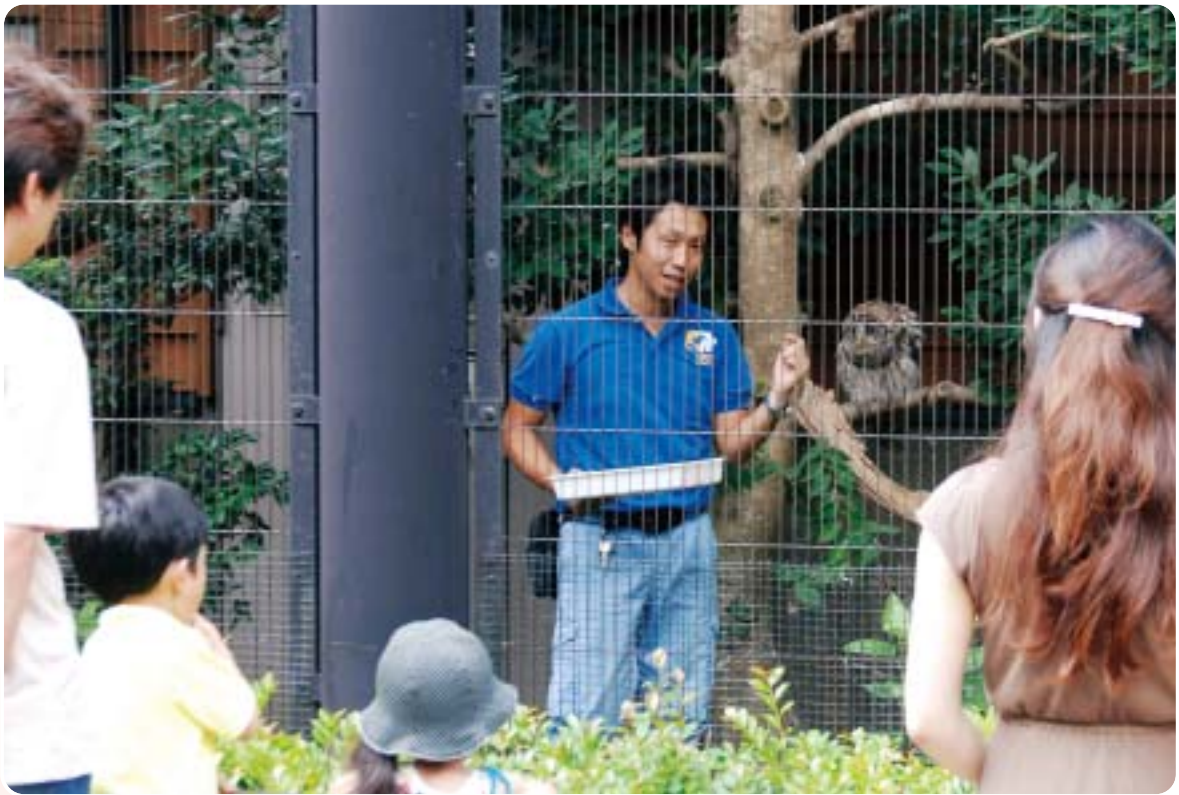
フクロウ舎の中でお食事ガイド。フクロウはエサにネズミやヒヨコを使うので、可愛いもの見たさからか、けっこう人気があります。