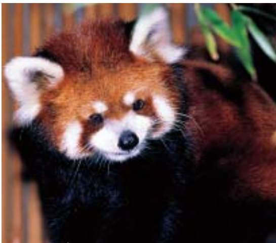
群馬から新しくやって来たメスのメロン

さて、そんなメロンですが、次はタンタンとの同居にチャレンジせねばなりません。メロンは9歳と、レッサーパンダにしては正直あまり若い方ではありません。そんなにのんびりもしてられないかもしれません。レッサーパンダの繁殖期は冬の寒い時期なのでそれに間に合うようにそろそろお見合いから始めてみようかと考えているところです。