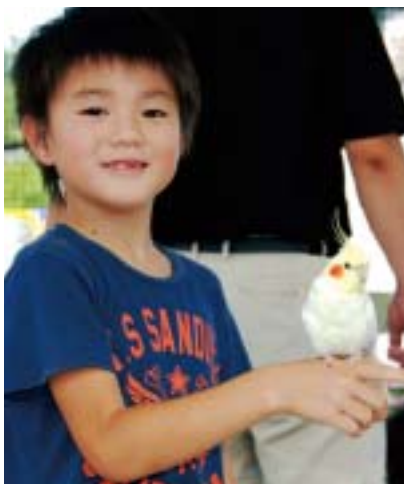
なかよしハウスでは手乗りのオカメインコがまっています

9月下旬からは時間限定で公開も始めました。お昼前後の2、3時間ですが、動物リハビリセンターの窓越しに、ケージに入った“イチゴ”を見ることができます。ただし当日の体調などで、急に公開が取りやめになることがあります。まだまだ小さなコドモですので、その辺りの事情はおくみ取り