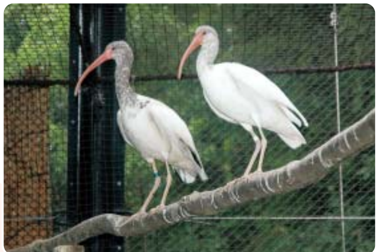
2年目のシロトキ。平成19年に人工繁殖で生まれた鳥たちです。この2羽も鳥担当がヒナから育てあげたものです。