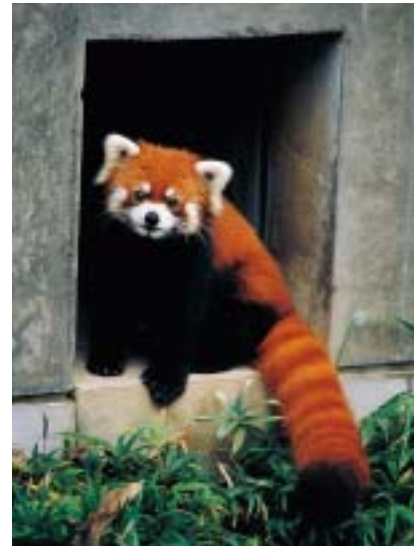
年上のお嫁さんをもらう事になったタンタン、仲のよいカップルになって欲しいものです。

って木に登って何とか下に降ろしたのですが、シュートに入らずパドックをグルグル回ってまた木に登ってしまいました。やれやれ...、そこまですら30分ほどかかったでしょうか。外は室内と違ってそのまま置いて帰るわけにはいかないのどうしようかと考え、ホース