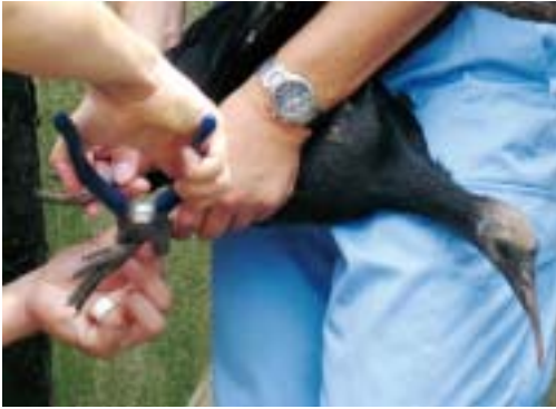
識別のために、大きくなったヒナに足環を取り付ける

す。取り付けてからしばらくすると、ホオアカトキの夫婦は巣箱に仲良くとまるようになりました。読みは的中中です。