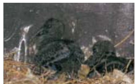
巣箱の中のヒナ、全身真っ黒で見えにくい

今年繁殖期前の2月に、昨年巣作りした場所の近くに巣箱を作って取り付けました。多摩動物公園などで使用している長屋式のもの違って1ペア用の小さな巣箱でしたが、昨年の事を考えれば、これでも十分なはずです。もう雨にぬれる事はないし、壁にピッタリついているので安定性も抜群で