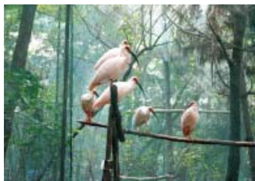
中国周至県で飼育されているトキ

その一方で中国から贈られたトキは順調に繁殖し、現在は120羽を超えるまでになりました。このトキを訓練して佐渡に放し、2015年までにトキ60羽を野生に定