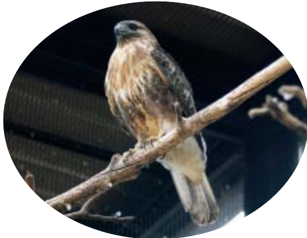
タカの仲間、ノスリのピーちゃん。タカ舎の中の掃除やエサやりは一見危なそうに見えますが、実はたいした危険はありません。おとなしいのです。