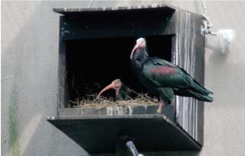
取り付けした巣箱で巣作りした夫婦

今年2008年、水鳥たちの池で飼育しているホオアカトキが繁殖に成功しました。このホオアカトキは2004年11月、多摩動物公園からやって来た成鳥2羽と4羽の幼鳥で、いっしょに来たクロトキ6羽とともに水鳥たちの池に放されたものです。