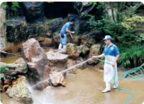
水鳥たちの池は2週間に一回、休園日に水を抜いて掃除をします。たまった砂や落ち葉を取って池を掃除し、水も交換してきれいにしています。