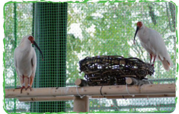
● 종의 보존