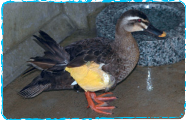
● 야생동물의 보호