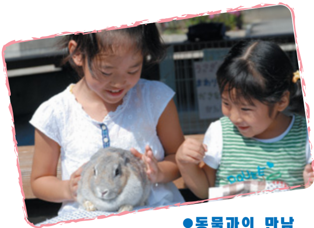
● 동물과의 만남

이시카와 동물원은 1999년 10월에 이 자리에 오픈했습니다. 면적 23ha의 원내에는 약 170종 3500마리의 포유류 및 조류, 양서류, 파충류, 어류 등을 사육하고 있습니다. 동물과의 만남, 식사 안내, 박력넘치는 전시를 통해 동물들을 보다 친근하게 느낄 수 있는 시설입니다. 그리고 동물의 배설물로 퇴비를 만들거나 빗물을 이용하는 등 친환경 활동에도 힘쓰고 있습니다.